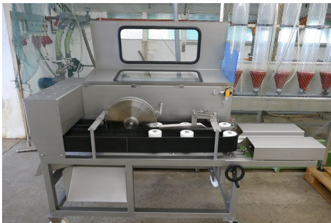
Wie auch große.