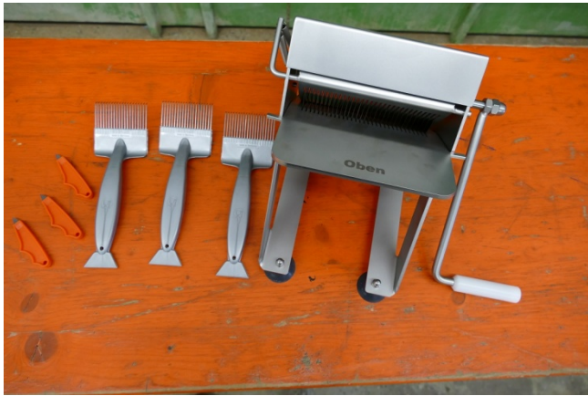
Sei es für kleine Betriebe